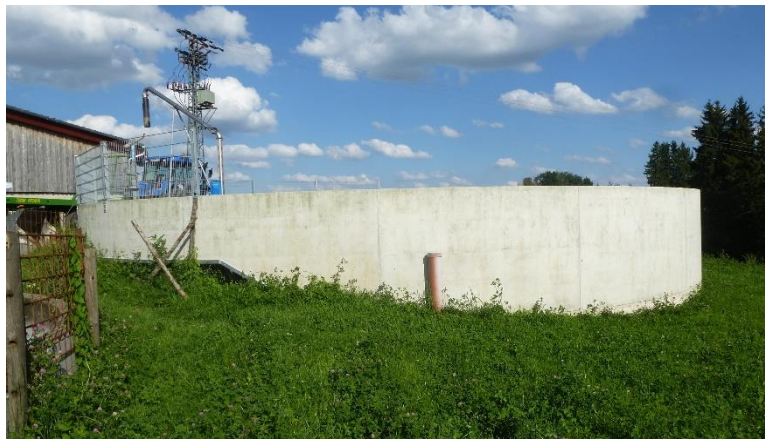
Wirtschaftsdünger im Blick:

Um eine gezielte Düngung zu gewährleisten, ist es notwendig, die Nährstoffgehalte eigen produzierter Wirtschaftsdünger zu kennen. Des Weiteren sind ausreichend Lagerkapazitäten für Wirtschaftsdünger vorzuhalten, um den Dünger bedarfsgerecht für die Pflanzen ausbringen zu können.